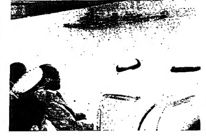
الملك خالد والرئيس السادات يرافيان الماتريس البحرية

الفروسية : مسابقات امس واثنين اليوم نظم اتحاد الفروسية بعد ظهر امس في الميدان الرئيسي للجنة الرياضية ثلاث مباريات بطلان من الحواجز الثلاث ( د ، ج ، ب ) وفيما يلي النتائج الفنية : ● الفلة د ( ١٢ حلجا برفض ) ١٢٠ سم بعد دورة تمليز بينها ملكة مع سائبة ماد صفرية ( فازت بالركب الاول كريستيان مابور على سبيت فاير ( الحصان العربي ) دون خطأ ٢٧٤.٦ نقطة . ● الفلة ج ( نفس الحواجز مع سائبة كبيرة الارتفاع ١٢٠ سم بعد دورة تمليز ) حل اولاً مكرم علم الدين على ريك تراك ( الخيول ) ٤ اخطاء ٨٦٤.٢ نقطة . ● الفلة ب ( نفس الحواجز بارتفاع ١٤٠ سم بعد دورة تمليز مع سائبة كبيرة ) فاز بالمرتبة الاولى مكرم علم الدين على كاتيا ( الخيول ) دون خطأ ٨٧٤.٤ نقطة . ويتم الاتحاد اليوم في الساعة الرابعة بعد الظهر مباريات بالفروسية الاولى للفلة ( د ) والثانية بفرجة ليم. التتبع ج و ب على مرحلتين ونسب النتيجة يجمع النقاط والوقت للراجلين .